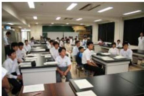
閉講式前の“まとめ”より